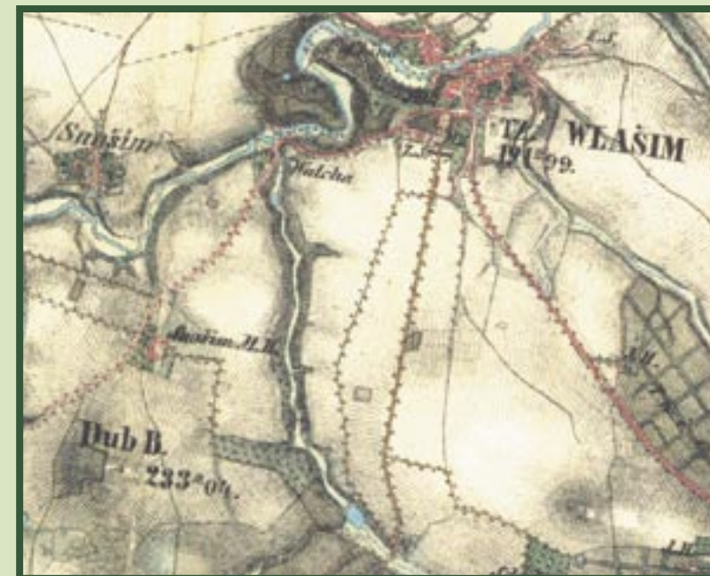
Vlašim a Vorlinské údolí na mapě druhého vojenského mapování.

Téměř celé údolí je pokryté lesy. Na dně údolí podél potoka nacházíme olšovo-jasanové luhy. Roste zde olše lepkavá ( Alnus glutinosa ), jasan ztepilý ( Fraxinus excelsior ) a vrba bílá ( Salix alba ). V podrostu jsou výrazné žlutě kvetoucí blatouchy bahenní ( Caltha palustris ), orseje jarní ( Ficaria verna ) a křivatce žluté ( Gagea lutea ). Ve vlhčích částech svahů jsou rozšířeny dubohabrové háje. Mohutné duby letní ( Quercus robur ) rozptýlené po údolí jsou pozůstatkem někdejších šlechtických lesů. Duby doprovází habr obecný ( Carpinus betulus ), z keřů zde roste líska obecná ( Corylus avellana ). Na jaře dubohabřiny hrají barvami květů. Najdeme zde jaterník podléšku ( Hepatica nobilis ), sasanku hajní ( Anemone nemorosa ), plicník lékařský ( Pulmonaria officinalis ) nebo pitulník žlutý ( Galeobdolon luteum ). Typickou rostlinou dubohabřin je kopytník evropský ( Asarum europaeum ), ten však své fialové květy skrývá mezi listy. Ve vyšších částech svahů a na plošinách nad údolím se rozkládají doubravy. Hlavní dřevinou jsou zde duby letní doprovázené březou bělokorou ( Betula pendula ),