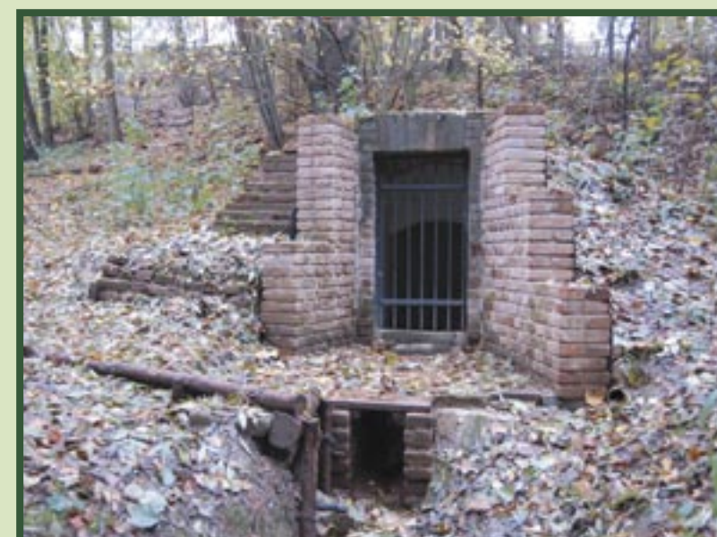
Studánka opravená Lesy ČR.